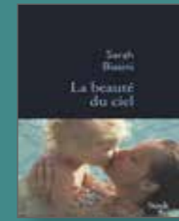
La beauté du ciel, Editions Stock, 2021